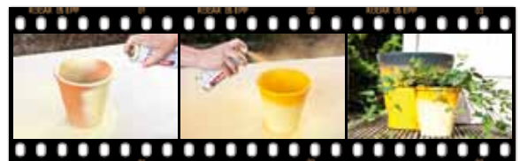
Anwendungsfilme mit Step-by-Step-Anleitungen für Instore-TV oder Ihre Website

Ordern Sie großes Umsatzpotenzial auf kleiner Fläche – mit den neuen Permanent Sprays von edding!