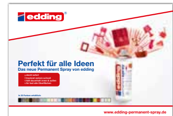
Umfangreiche PR-Kampagne zur Einführung