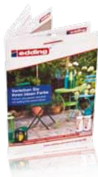
Endkundenbrochüre mit Anwendungsideen und Tipps & Tricks rund ums richtige Sprühen Art.-Nr.: 2-961912