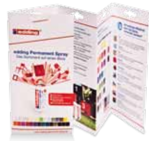
Produktflyer mit allen wichtigen Produktvorteilen für Ihre Kunden Art.-Nr.: 2-961913